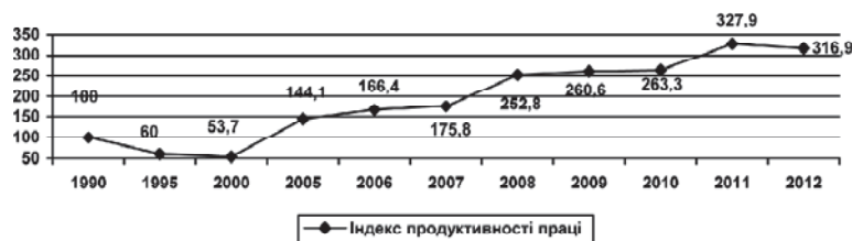
Рис. 2. Динаміка індексу продуктивності праці в Україні

З 1990 р. простежується тенденція до зниження прибутковості аграрних підприємств, а у 2000 р. прибуток досяг від'ємних значень. Збиток, що був зафіксований у 2000 р., що, на нашу думку, спричинено ліквідацією та реорганізацією діючих підприємств та появою нових організаційно-правових форм господарювання, які тільки почали працювати і були не в змозі одразу забезпечити максимальну ефективність виробництва. Далі спостерігається поступове